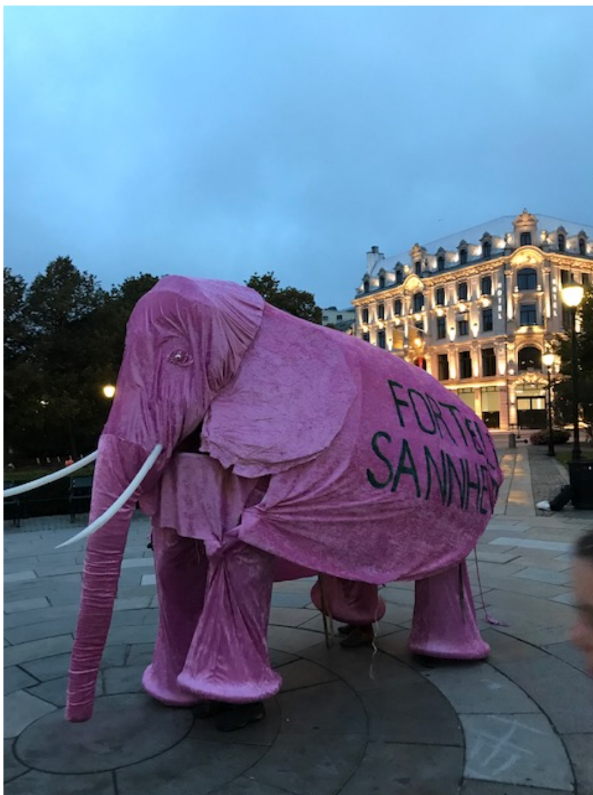
Den rosa elefanten ankommer Eidsvolls plass.

Jeg får etterhvert beskjed om at folk begynner å bli arrestert og mange har blitt bortvist fra Fredriks gate, der de første aksjonistene satt seg ned i veibanen. Jeg har masse spørsmål. Hvor er de? Hvorfor blir de arrestert så tidlig? Det var vel ikke planen? Jeg får en melding om at noen trenger hjelp med å frakte tingene sine til Eidsvolls plass, det kan ikke ligge igjen i krysset. Jeg melder meg til å hjelpe til med bæring for å se hva som skjer og blir fulgt av noen som nettopp har vært der nede. Jeg går nedover Karl Johan mot Fredriks gate. I krysset mellom de to gatene sitter aktivister i grupper ganske spredt fra hverandre. Det er et stort kryss med to felt bilvei begge veier og et fotgjengerfelt som vanligvis er fullt av folk som krysser eller venter på grønn mann. Politiet har sperret av området med sperrebånd og advart om at de som er innenfor båndet kan bli arrestert. Derfor blir de fleste fra XR som er til stede stående på utsiden av sperringen og mister kontakten med de røde aktivistene. Jeg hjelper til