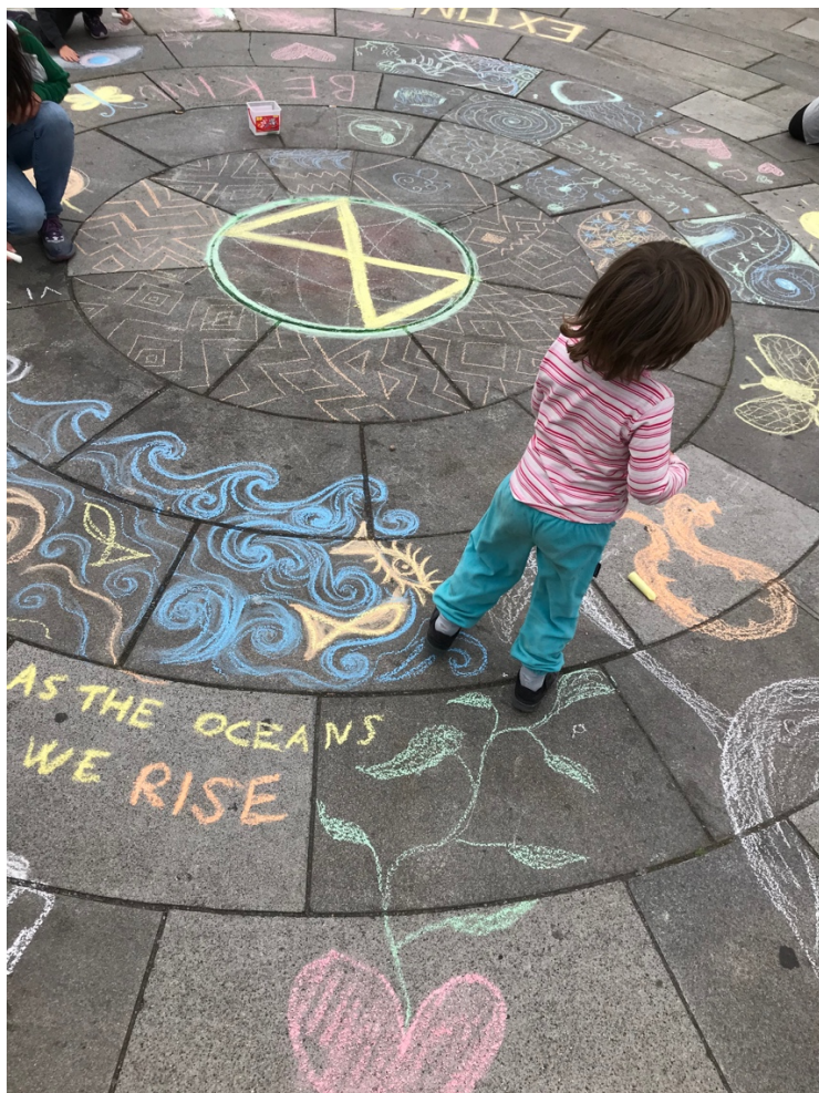
Krittegning på Eidsvoll's plass.

Vi rydder opp Eidsvoll's plass til klokken 19, da er det ikke lov å være der lengre. Det eneste som blir igjen etter XR er en ring med farger, bølger, sommerfugler, blomster, en xr-logo og teksten «AS THE OCEANS WE RISE». For aktivistene er det viktig å tydeliggjøre at aktivismen deres ikke handler om å bryte loven «på trass», men for å rette fokus mot nettopp klima- og naturkrisen. Ved å pakke sammen tidsnok og rydde opp etter seg etter enhver aksjon, viser de at de følger regler og pålegg fra politiet når det handler om andre ting enn selve aksjonen. Dette er med på å bygge opp tillit hos politiet og fjerner muligheter for kritikk i etterkant. Smittevernreglene ble også tatt på høyeste alvor, og det oppsto ingen kritikk mot dette etter aksjonen, da det ikke var noen smitte som kunne spores til denne dagen.