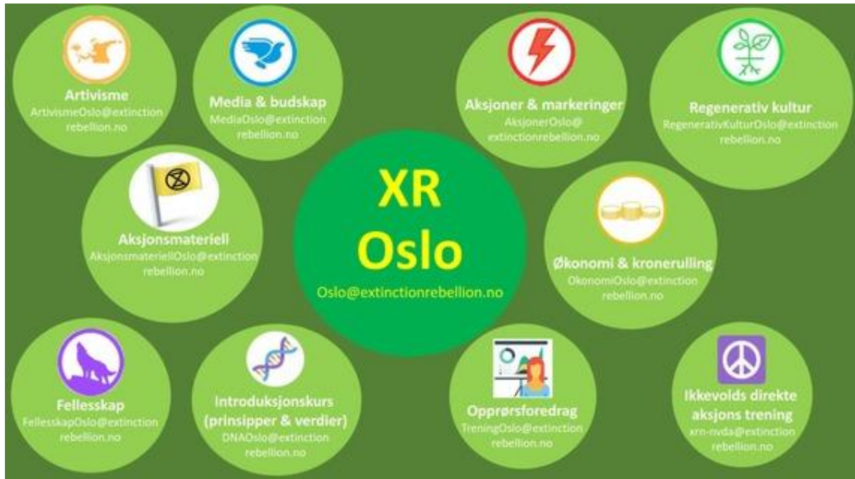
Oversikt over XR Oslos organisering. Hentet 31.05.2021 fra extinctionrebellion.no

XR Oslo 4 . Hver arbeidsgruppe har en intern og en ekstern koordinator. De har henholdsvis ansvar for å legge til rette for møter og kommunisere med andre arbeidsgrupper og andre lokallag om felles mål.