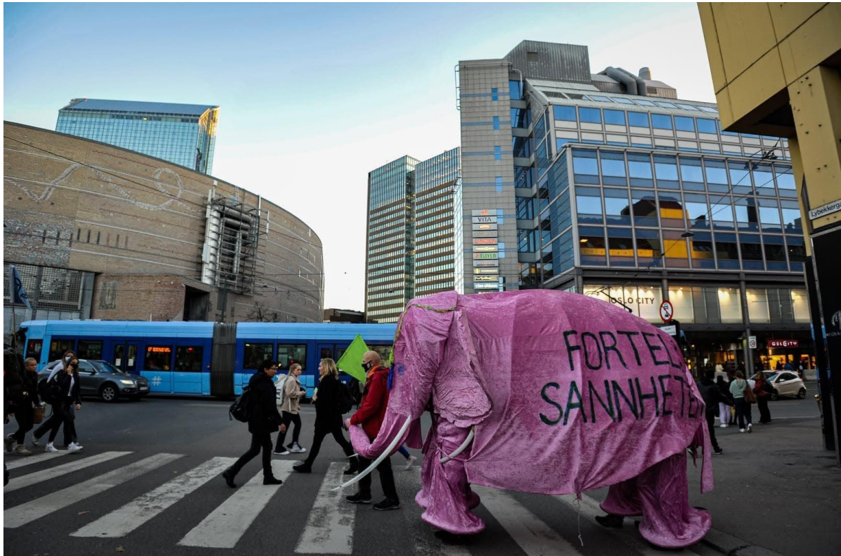
Den rosa elefanten på oppdrag. Meg i høyre ben foran.