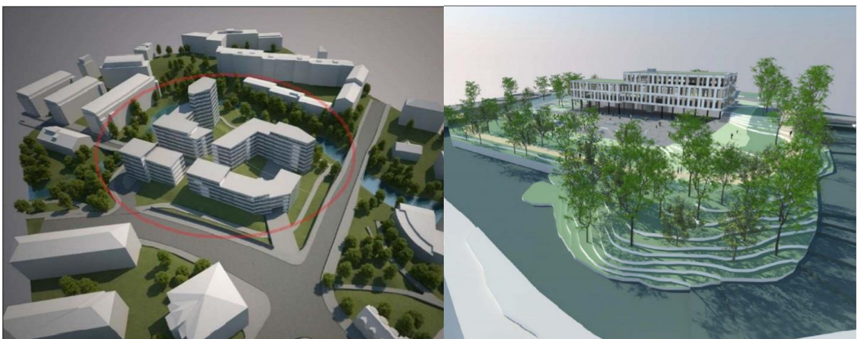
Bilde: Originale planforslaget markert med rødt til venstre, og Plan- og bygningsetatens forslag til skole og friområde.

Som et avsluttende ledd i transformasjonen av Lilleborg såpefabrikker, ble det i 2018 vedtatt at nabotomten i Treschows gate 16 (bygget nederst i venstre hjørne figur 2) skal bli til undervisningsbygg, friområde, tursti og flerbrukshall (Oslo kommune 2018 3 ). Denne beslutningen ble vedtatt for å sikre at utviklingen av sosial infrastruktur gikk i takt med bydelens opplevde befolkningsvekst, og tilhørende fortettingsprosess. Det var i utgangspunktet planlagt at tomten skulle bli bygget ut til 260 nye boliger fordelt på 12 blokker med opp til elleve etasjer. Plan- og bygningsetaten mente i stedet at planområdet burde bli skole, ettersom Skolebehovsplanen 2016 – 2026 viste et økende behov for skoler som følger av befolkningsveksten i denne delen av byen. Planområdets størrelse og beliggenhet ville gjøre det godt egnet for skolebygg akkompagnert av et bredere friområde ved elven. Arealutnyttelsen til det originale planforslaget var dessuten for høyt, og forslaget brøt med kommuneplanens krav ettersom det ikke tok hensyn til arkitektonisk kvalitet eller omkringliggende grønnstruktur slik som Akerselven, et nasjonalt verneområde (Oslo kommune 2015 2 ). 28.02.18 ble forslaget til Plan- og bygningsetaten vedtatt av bystyret, og rivningen av det siste lagerbygget startet nå i august 2020.