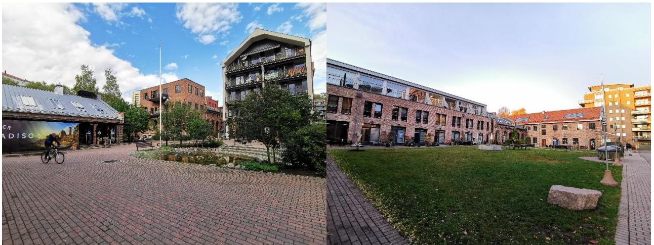
Bilde: Lilleborg torg med fontenen og restauranten, og gressplenen på baksiden av det restaurerte fabrikkbygget. Teateret ligger i fabrikkbygningen til høyre. Foto: Ingrid Marie Sundvor 2019.

Lilleborg ligger i bydel Sagene, og hører til delbydel Torshov i utkanten av indre by. Eiendommen ble kjøpt av NCC AS i 1999 med planer om å omregulere fabrikkbygningene fra industri til blant annet boliger, kontorer, serveringssteder, barnehage og fellesområder. 70% av alle leilighetene skulle være tre-roms eller større, og det skulle være mulig å konvertere inntil 50% av næringslokalene til boligformål (Oslo kommune 1999). I dag har området omtrent 405 seksjoner regulert til boformål i Ivan Bjørndals gate 1-34. Bygningene har fem til åtte etasjer og består av restaurerte fabrikkbygninger med påbygg nærmest elven, og nybygg som ligger et plan opp fra torget. Adkomst til nybyggene skjer enten ved å gå opp trappetrinnene fra torget mellom byggene, eller fra stien som går inn fra veien bak nybyggene. Nybyggene har også egne adkomster til parkeringsanlegg i de respektive kjellerne. Lilleborg har fire forskjellige lekeplasser, et torg med fontene og en relativt stor gressplen som er åpen og tilgjengelig for alle (Oslo kommune 1999). I de restaurerte bygningene ved elven er det også et teater, kafé/pub og restaurant. Det er også en liten nærbutikk ved torget, og kort avstand til en større matbutikk (Rema 1000) på andre siden av elven