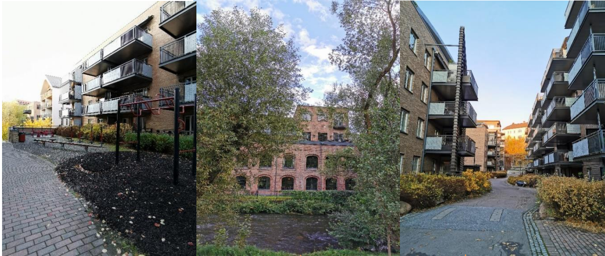
Bilde: Lilleborg sett fra lekeplassen i midten, turstien på andre siden av elven, og fra stien mellom nybyggene.