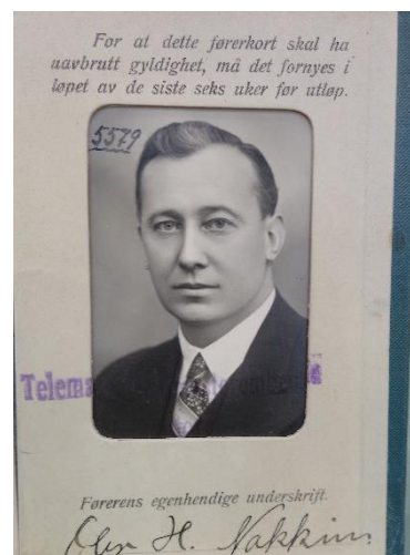
Figur 6: Lagfører Olav Hermann Nakkim