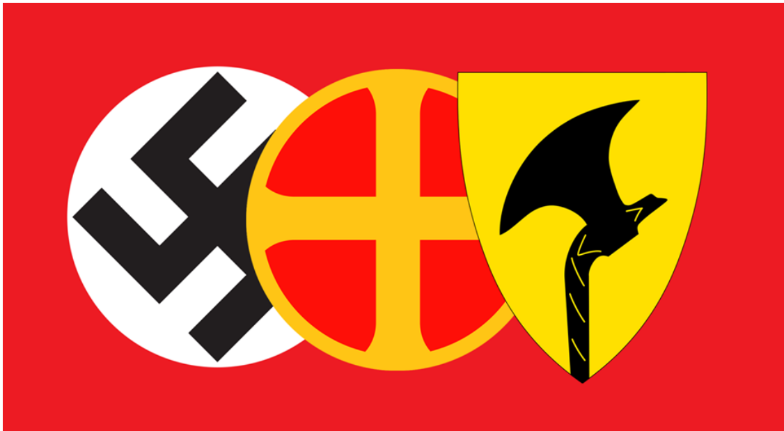
Figur 1: Fra venstre: Hakekorset, solkorset, og Telemarks fylkesvåpen. Illustrasjon: John Henriksen