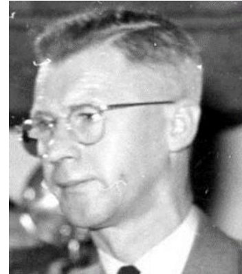
Figur 3: Josef Terboven.

rikskommisær Josef Terboven. Den første Quisling-regjeringen falt etter en uke. Allikevel ble NS det Statsbærende partiet under hele krigen. Men selv om NS samarbeidet med tyskerne, ønsket Quisling et selvstendig Norge, og arbeidet for en fredsavtale. Samtidig ønsket han dog at Norge skulle bli med i aksemaktene. 16