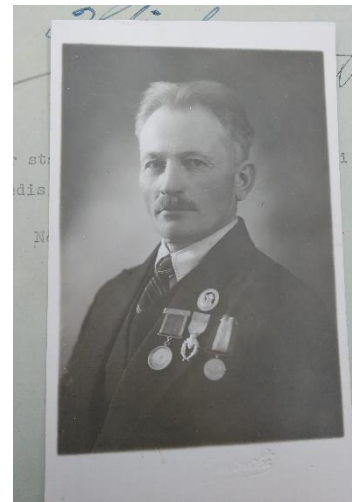
Figur 8: Ordfører Ketil Eika