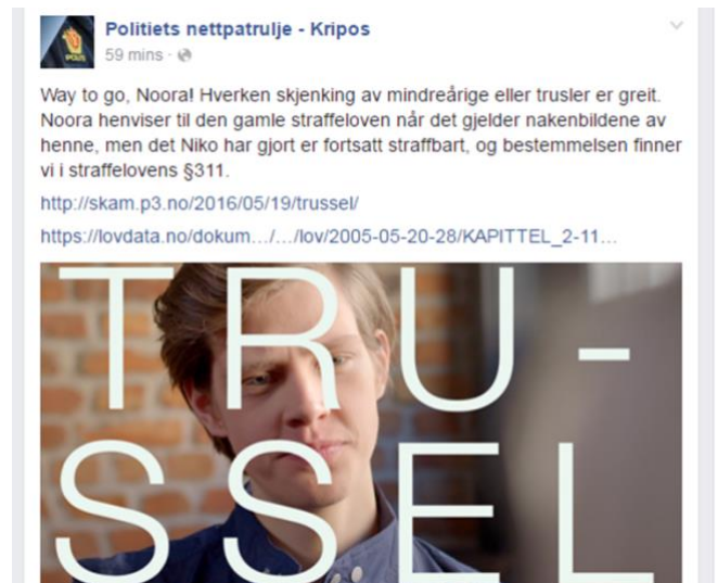
Figur 3: Kripes hyller Noora.