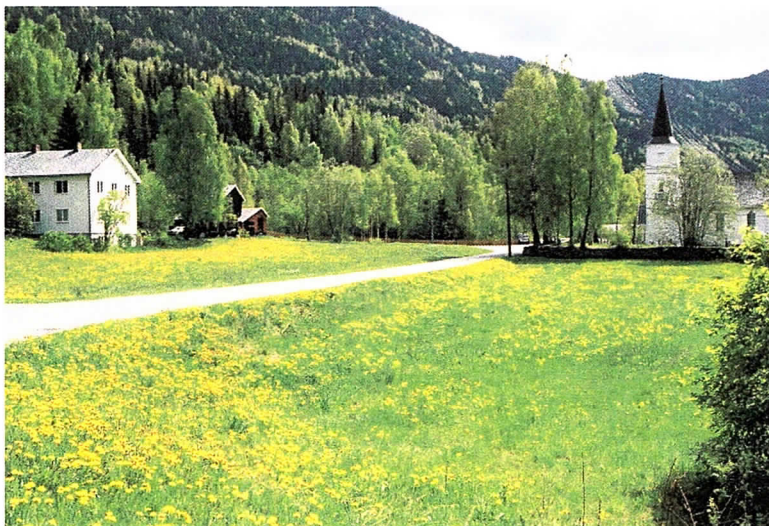
forgrunnen, før avdekkingen

Planområdet ligger ved Numedalslågen, ca. 2 km øst for Rødberg sentrum, 284 m o.h.. Her er gammel dyrkamark rett NV for dagens kirke og kirkegård som ligger på en flat terrasse langs Numedalslågen, øst for denne og 3- 4 m over.