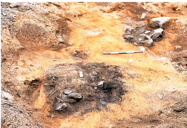
foto 23. F1, i bakgr. F2

Dimensjon ca. 0,90x0,90 m, dybde 0,20, flat bunn. Vel 1 bøtte skjørbrent stein tatt ut fra ½ grop.