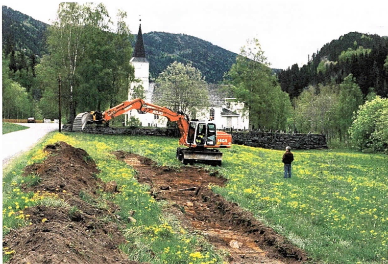
foto 25, gravemaskinen