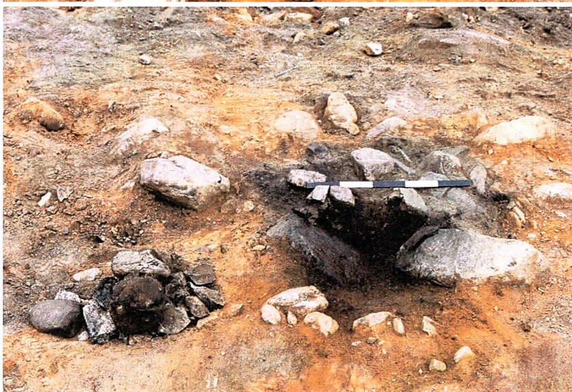
foto 16, grop F4

snittet. Kokstein fra ½ grop t.v. Datert til vikingtid.