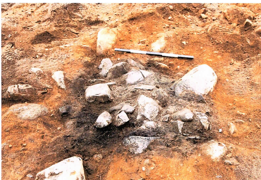
foto 22, grop F4

Dimensjon ca. 0,80x0,80 m, dybde 0,25 m. Gropa var gravet ned mellom to større stein, 0,20-0,40 m store, den ene tydelig avskallet av varme. Bunnens form var derfor uklar.