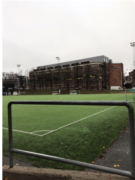
Figur 4 Fotballbanen på Dælenenga.

Når jeg spør hva hun pleier å gjøre på de ulike stedene forteller hun at Paulus plass er et sted hun og vennene er etter skoletid om sommeren. Her er det plass til at de kan spille slåball eller anti-kull (min forståelse), i tillegg til en fontene med vann man kan leke i. Likevel forteller Nora at det er Birkelunden de bruker mest. Der leker de "boksen går" og "har'n" – et sted med veldig mange bra gjemmesteder. På Dælenenga kan hun og vennene sitte på tribunen og snakke, mens andre spiller fotball der.