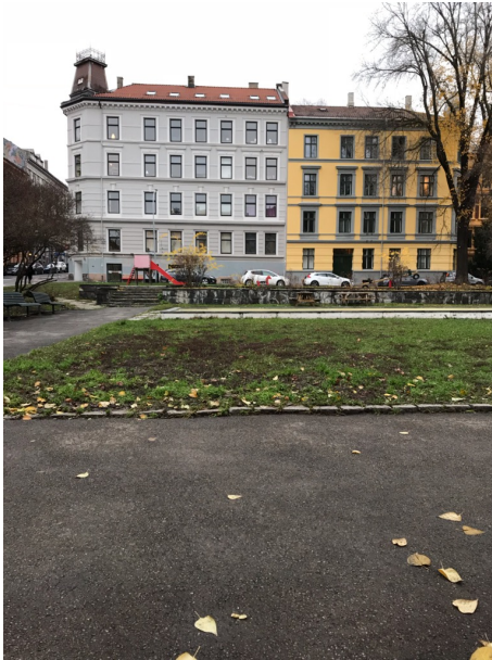
Figur 3 Paulus plass(bak Paulus kirke).

Nora går på Grünerløkka skole og er et av barna som i forkant av intervjuet hadde tatt noen bilder av steder hun liker å være (se kapittel 3). Hun har samtykket til at jeg kan bruke noen av bildene som en del av hennes fortelling av steder hun bruker. Stedene Nora har tatt bilde av er Paulus plass, Birkelunden og Dælenenga, og hun beskriver det som steder hun liker å være på Grünerløkka.