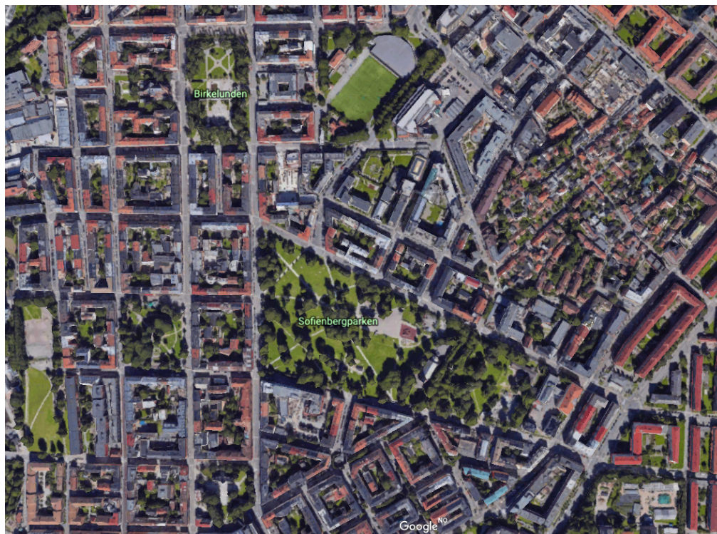
Figur 2 Flyfoto over Grünerløkka.

Gjennom den opprinnelige gate planen for Grünerløkka fikk området et system av byrom som bestod av tre typer uterom: et nett av representative offentlige bygater, et sett av helt offentlige plasser og parker integrert i gatenettet (Birkelunden, Olaf Ryes plass og Schous plass) og bakgårder (Haslum 2005). Funksjonen til bakgårdene var på dette tidspunktet i hovedsak å romme hverdags rot knyttet til boliger og virksomheter, og fremstod ofte som trange og mørke. Nye typer av uterom ble ifølge Haslum (2005) tilført i forbindelse med byfornyelsen på 70- og 80-tallet. Bakgårdsbebyggelse ble blant annet revet og mange kvartaler fikk nye halvprivate gårdsrom som følge av en parkmessig forbedring av sammenslåtte bakgårdarealer. Flere av mine informanter bor i typiske bygårder hvor det etter byfornyelsen ble omgjort til større indre rom/bakgårder.