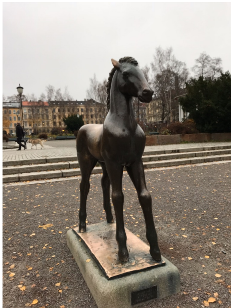
Figur 5 "Hesten" i Birkelunden.