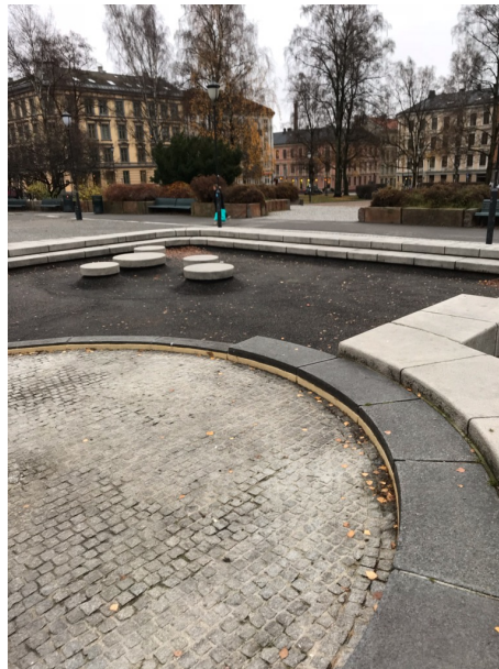
Figur 6 Fontene (uten vann) i Birkelunden.

Nora forteller meg i tillegg om et hemmelig sted hun og vennene noen ganger drar til, og jeg tolker det som et spennende sted som ikke så mange vet om.