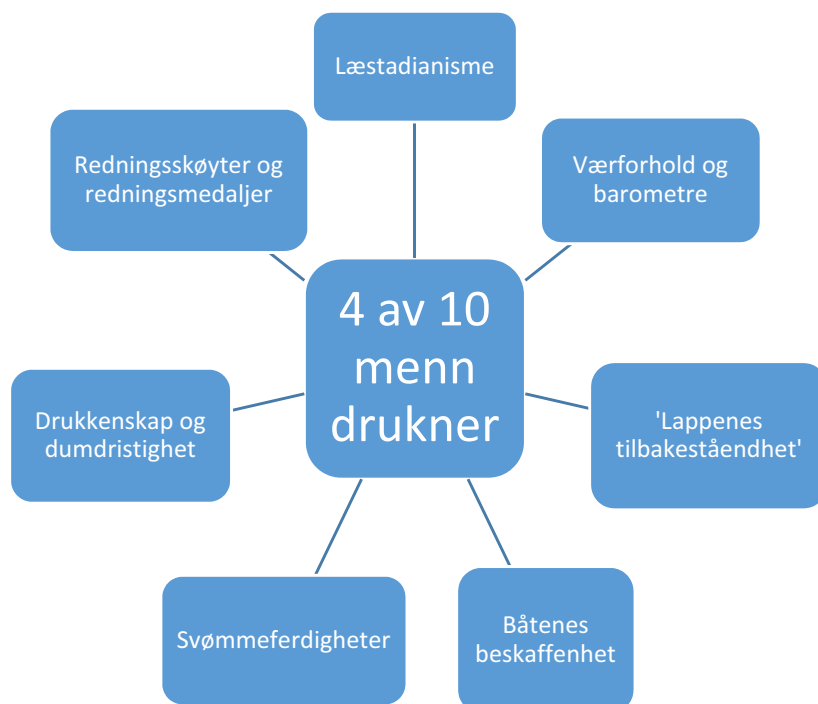
Figur 1. Forhold som kunne tenkes å forårsake drukningsulykker i Tromsø stift

Eilert Sundt bearbeidet tallmaterialet til presise tidsserier som viste utviklingen i drukningsulykker over tid, og i forhold til sted, årsak, og kjønn og alder på de druknede. Han fant at antall druknede var nokså stabilt fra 1841 til 1861, til tross for at befolkningen økte markant i samme periode. På bakgrunn av dette beregner han så at det hadde vært en «besparelse» av 300 menneskeliv mellom 1845–50, og kommenterer at dette er i sig selv en stor sag . Men den blir dobbelt gledelig for teologen Sundt, idet han mener å kunne tolke det slik at besparelsen hovedsagelig eller dog for en anseelig del skyldes den lykkelige vending der er indtruffet i befolkningens åndsliv og som særlig merkes gjennom en overmåde nidkjær og virksom iver mot fylderiet (Sundt 1967 [1862]:39). I en fotnote utdyper han denne usædvanlig sterke religiøse bevegelse som for nogle år tilbage grep enkelte finne-menigheder , men som snart førte til sørgelige forvildelser og udskeielser (ibid.:40). Sundt viser her til den skotske professor Forbes' beskrivelser av den svenske misjonæren Læstadius etter en reise i Troms i 1851. Færre drukningsulykker kunne altså forklares med læstadianismen, med edruelighet som mellomliggende variabel. (Læstadius virket i 1840-årene, og Kautokeino-opprøret fant sted i 1852.)