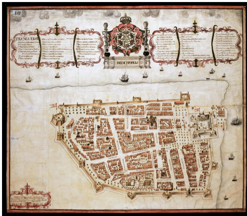
Trellundkartet, 1733. Opphav: Trellund, Gregers Daa Ingeniørkorpset.