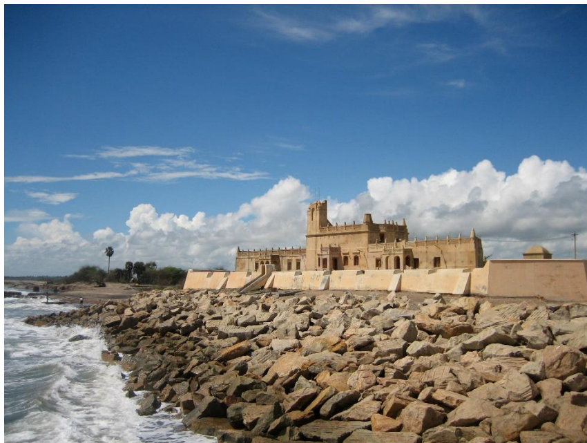
Fort Dansborg i 2006.