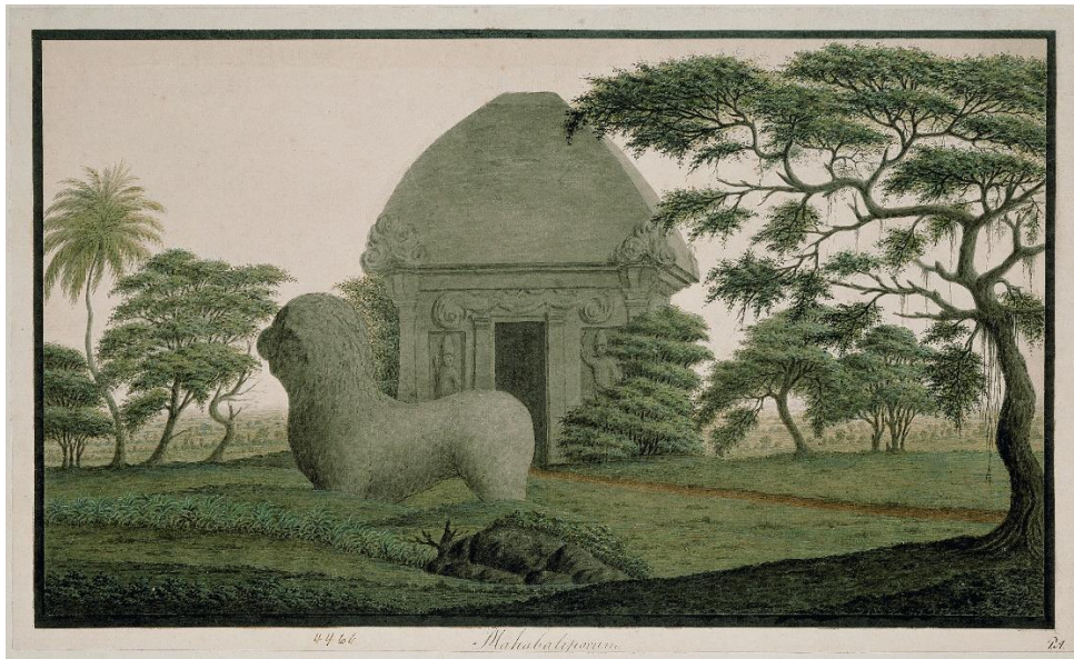
Steinmonumentene ved Mahabalipurum. Malt av Peter Anker, ukjent år.