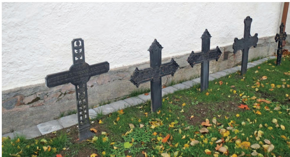
26. Fem gjutna kors från 1800-talet i Torp har flyttats från sina ursprungliga platser och placerats utmed den yttre kyrkväggen. Korset till vänster tillhör den ihåliga varianten av gjutna kors.

De gjutna staketen är ännu mer hotade ur kulturarvssynpunkt än korsen eftersom de lättare går sönder i fogarna mellan de fyra sidorna. Därför har flera sådana staket försvunnit