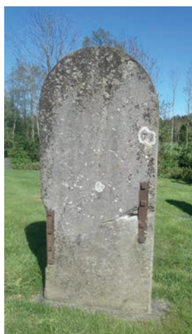
24. Baksida på en smal och rundad kalksten i Långelanda som renoverats med järnbeslag efter att ha brutits av. Kalkstenen var rest över en bonde (1811-1880) och hans hustru (1812-1882).

Gjutgodset i de gjutna korsen är besvärligt att renovera. Blästring kan användas för att ta bort rostent och varefter målning måste ske. Svårigheten och kostnaderna med renovering