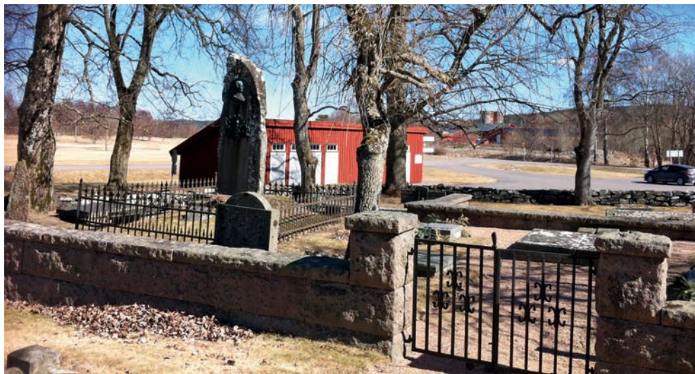
11. Bildtkyrkogården i Morlanda år 2014.