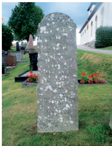
23. Inskriptionen på denna kalksten i Myckleby från 1868 är i stort sett omöjlig att läsa på grund av mossor och alger.

En i fråga om många kalkstenar nödvändig åtgärd är att på ett försiktigt och skonsamt sätt tvätta bort mossor och alger utan att texten på de porösa stenarna skadas. Högtryckspolning utan tvättmedel har använts i sådana fall då rengöring påbörjats. Efteråt behöver inskriptionerna fyllas i med färg med tanke på läsbarheten för eftervärlden. På flera kalkstenar är det i nuvarande skick omöjligt att läsa inskriptionerna och bildsymbolerna, vilket är otillfredsställande med tanke på framtida generationer (bild 23). I vissa fall kan man se att kalkstenen blivit reparerad efter att ha utsatts för en yttre fysisk skada när den fallit omkull (bild 24). Med tanke på att materialet är poröst måste kalkstenar kontrolleras noggrant så att de är väl förankrade i sin sockel och inte riskerar att falla (bild 3 och 25).