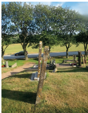
25. Den bakre kalkstenen i Morlanda är väl förankrad i en sockel och står därför upprätt. Den främre kalkstenen däremot lutar kraftigt och kan falla omkull.

har medfört att en del gjutna gravminnen har tagits bort från kyrkogårdarna. Andra har lagats, blästrats och målats. I en del fall har de flyttats från sin ursprungliga plats och blivit uppställda utmed kyrkväggen. Detta är fallet med fem av åtta kors i Röra, tre av fyra kors på Käringön och alla de fem bevarade korsen i Torp (bild 26). Här är de skyddade mot skador som kan ske i samband med skötseln av kyrkogården. Vissa gjutna gravkors har under 1900-talet ommålats med guldfärg av ättlingar till de avlidna.