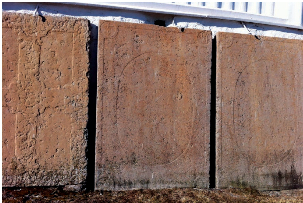
22. Tre stora stenblock flyttades från kyrkogolvet i Fiskebäckskil och restes utmed den yttre kyrkväggen. Ursprungstexten är mestadels utplånad och oläslig.

I Valla på Orusts grannö Tjörn har kyrkogårdsförvaltningen 2015 valt ut de äldsta överblivna stenarna och en eller två från varje årtionde under 1900-talet. Man har tvättat dem och placerat dem i en rad utmed kyrkmuren på ett föredömligt sätt. Då undgår de att bli förstörda och utgör också en pedagogisk utställning för den besökande allmänheten.