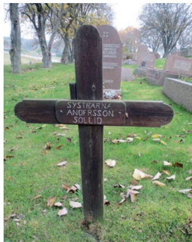
27. Impregnerat och väl underhållet träkors i Morlanda som rests över två systrar Andersson från Sollid utan angivande av födelse- och dödsår.

möjligt för allmänheten både nu och i framtiden. Tack vare förbättrade impregneringsmetoder kan vi få se fler träkors i barnbarnsgenerationen. Trä är ju ett billigare alternativ jämfört med de betydligt dyrare stenarna.