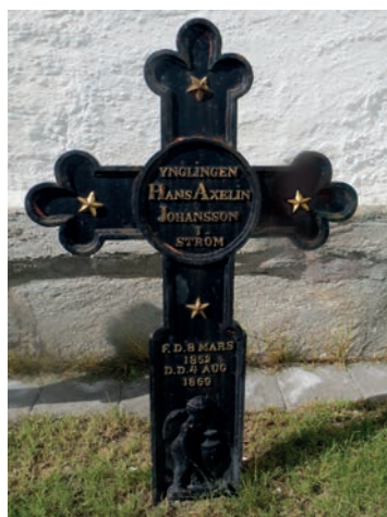
16. Ett väl restaurerat och ommålat treklöverformat gjutet kors med flera stjärnor över ynglingen och bondsonen Hans Axelin Johansson i Torp som avled 1869 sjutton år gammal. En ängel med vingar finns längst ned på korset.

Gravminnen över ogifta ungdomar mellan 15 och 25 år förekommer i mycket begränsad omfattning på 1800-talet. Begreppet yngling är inskrivet på det gjutna kors som restes över en ung man i Torp som avled 1869 i en ålder av sjutton år (bild 16). Ju äldre man var vid dödsfallet desto större var möjligheten att få ett bestående gravminne rest över sig. Detta visar på respekten för äldre människor men kan också peka på betydelsen av de ekonomiska förutsättningarna för att de efterlevande skulle ha råd att bekosta ett varaktigt gravminne. Under 1900-talet har minnesmärken över ungdomar tilltagit markant vilket tyder på att ekonomin tillmätts mindre betydelse jämfört med känslorna av sorg när en ung människa avlider (Gustavsson 2011, s. 39ff).