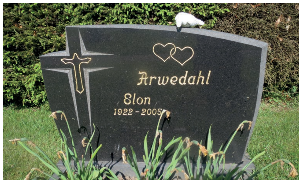
19. Ett uppståndelsekors i Långelanda över en man som tillhörde en frikyrka och som avled 2005 83 år gammal. Två sammanflätade hjärtan markerar kärleken mellan makar. En vit duva ovanpå gravstenen symboliserar fred. Denna symbol blev vanlig på 1930-talet men är numera ovanlig.