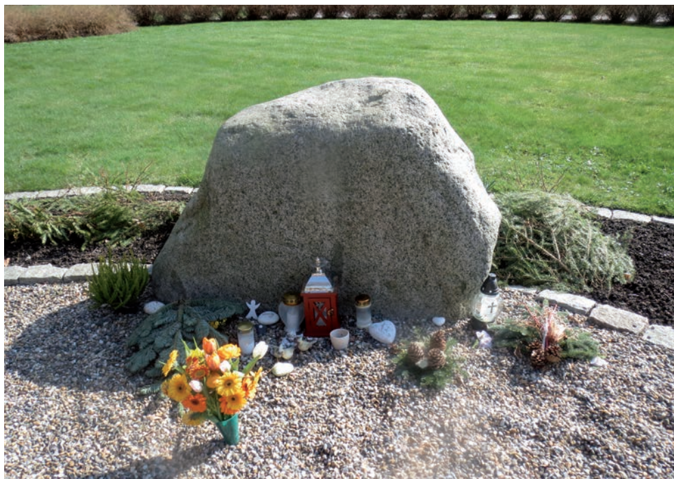
20. Minneslund på kyrkogården i Röra. Här får inga upplysningar lämnas om vilka avlidna som vilar där. Det vet endast kyrkogårdsförvaltningen. Anhöriga kan komma och placera snittblommor och/eller ljus eller anonyma minnessaker.

Som en klar kontrast till individuella gravminnen uppkom under senare delen av 1900-talet minneslundar . Den första anlades i Västerås 1956. Då är anonymiteten total och har varit önskad av de avlidna och/eller deras anhöriga (Åkesson 1997). På Orust har sådana minneslundar inrättats först under 2000-talet (bild 20). Praktiska skäl ligger många gånger bakom valet av anonym gravplats. Anhöriga har ansett sig ha svårigheter att kunna sköta om sina anförvantes gravar i framtiden. Detta har skett i takt med en tilltagande migration när många människor inte längre är stationära utan flyttar omkring under sitt liv. Anonymiteten har dock en baksida för de efterlevande och senare generationers ättlingar. En motreaktion mot minneslundarna har gjort sig gällande i Sverige. Anhöriga har saknat en beständ plats att besöka för att uttrycka sorg och att minnas. Detta har framkommit vid intervjuer som landskapsarkitekt Inger Berglund har utfört