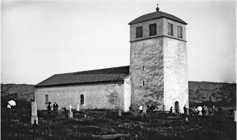
9. Morlanda kyrka och kyrkogård 1903. Notera de få gravminnena och det växande gräset på kyrkogården.