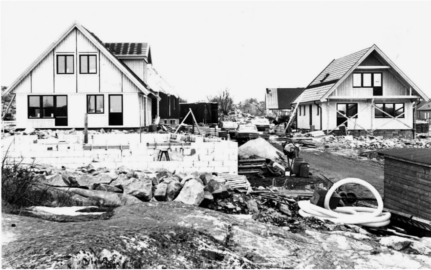
Foto 1980 från utkanten av Fiskebäckskil som visar hur yngre ortsbor vid denna tid byggde och bosatte sig i kustorternas utkanter.

eftertraktade av utomstående, och där det rådde byggnadsförbud. På 1970-talet började även en del yngre ortsbor, till skillnad från på 1950- och 1960-talen, att visa intresse för att förvärva äldre fastigheter i samhällskärnorna. När detta inte var möjligt blev alternativet som många yngre valde, att bygga nya hus i utkanterna av kustorterna.