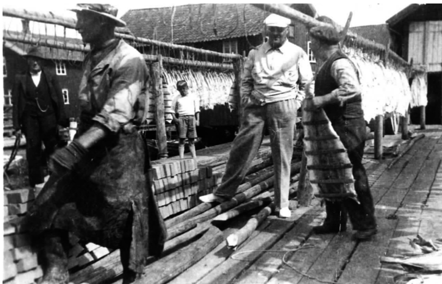
Sommargäster gick ofta runt och tittade på när lokalbefolkningen utförde sitt hårda arbete med att bereda spillånga som skulle hängas upp till tork. Bilden är tagen i Mollösund i början av 1900-talet.

vara orsaken till detta? En ekonomisk förklaring spelar en avgörande roll. Inkomsterna från uthyrningen utgjorde ett välkommet tillskott till hushållsekonomi i många familjer. En kvinna i Bovallstrand, född 1907, berättade om uthyrningen under hennes barn- och ungdomstid: »De bodde väldigt primitivt. Men det var ju en krona att tjäna, något fantastiskt att tjäna lite extra. Så de försakade gärna allting för att få hyra ut. De var måna om det» (IFGH 6974). På 1920- och 1930-talen kunde hyresinkomsterna enligt studerade inkomsttaxeringslängder på Käringsön utgöra mellan tio och trettio procent av de totala hushållsintäkterna. Dessa inkomster var vad kvinnorna kunde bidra med till hushållskassan.