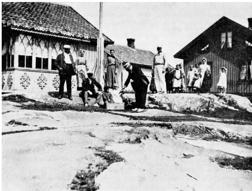
En överste med spatserkäpp under armen böjer sig ned för att dela ut godsaker till två bofasta barn på Kåringön 1907. En sådan handling kunde bidra till att understryka sommargästernas sociala överläge över ortsborna.

En man på Kåringön, född 1876, antecknade i sin dagbok den 8 augusti 1899: »Grevinnan var här på eftermiddagen. Hon gav mamma en liten bok med