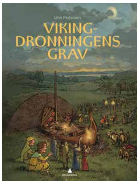
Figur 3:

omfangsberegnet sakprosadelen til 23 sider, til tross for at boken har omtrent dobbelt så mange sider med tekst. En god del av det jeg har skrevet faller følgelig utenfor det NFF regner som sakprosa. Slik kom inspirasjonen til denne artikkelen – og spørsmålet: Hva er faglitteratur for barn?