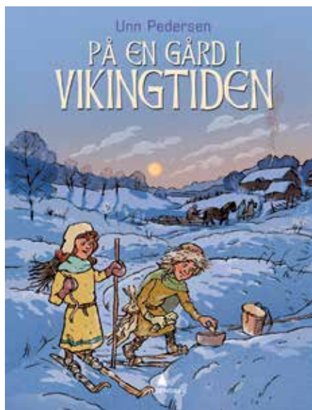
Figur 2: