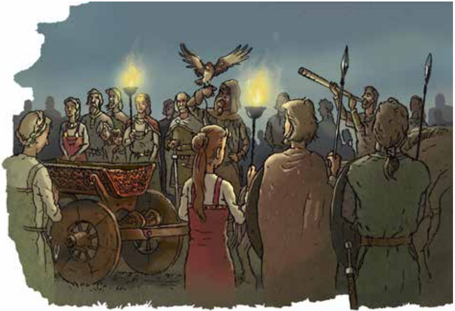
Figur 5: Det store opptoget.