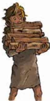
Figur 4: Livet i salen.