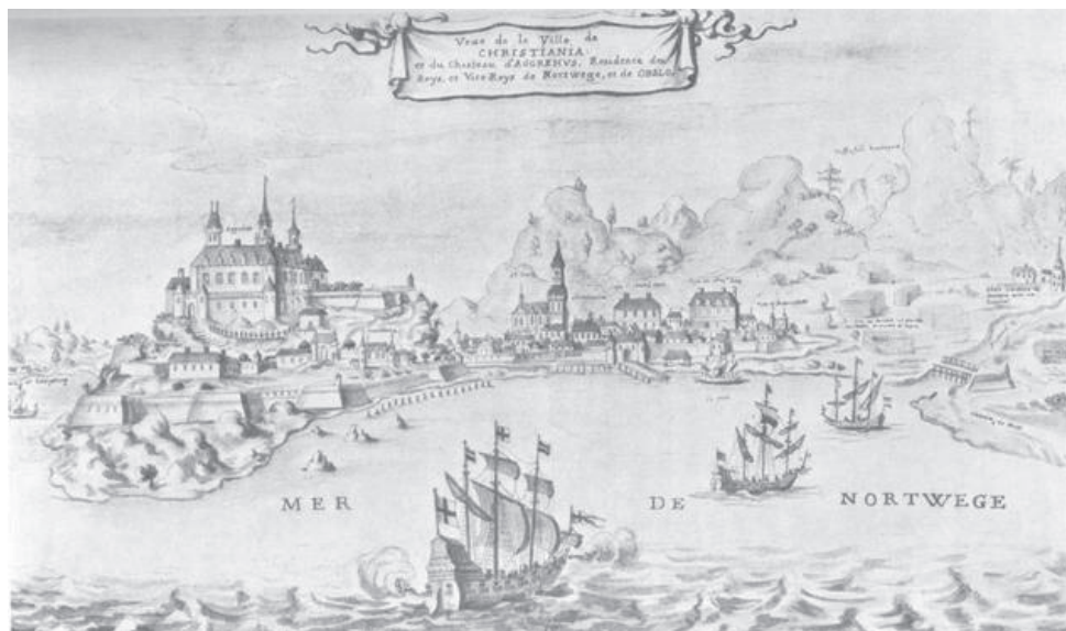
Fig. 1. Et delvis fantasifullt fransk prospekt av Christiania fra 1685. Fremst ser vi skipene på vei til bordtomtene på Grønland til høyre, der ser vi stabler med trelast som venter. Til venstre er maktens sete Akershus avbildet, og i midien er byen. Bakerst ser man Norges skog og fjell. (Fra Edvard Bull og Valborg Sønstevold: Kristianias historie , bd. 2: 1624–1740, Oslo 1927. Etter en original i Bibliothèque Nationale i Paris.)

at ekteskapsbånd og slektskapsbånd er viktige for å bidra til å forklare den norske bondeelitens handlinger. 20