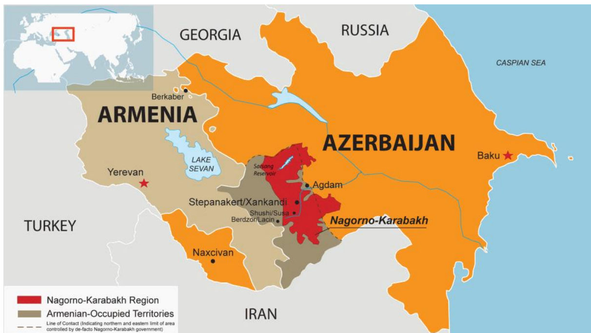
Illustrasjon 1: Kartet viser de originale sovjetiske grensene til NKAO, samt frontlinjen og de armenskokkuperte områdene ved krigens slutt. De armensk-kontrollerte områdene utgjør 13,62 prosent av Aserbajdsjan (De Waal, 2003, s. 286).

Både Armenia og Aserbajdsjan hadde på dette tidspunktet mønnet opp med tanke på en våpenhvile. Armenia manglet våpen, og var redd for å miste overtaket. Aserbajdsjan var på sin side redd for å miste mer territorium enn de allerede hadde. Etter voldsomme kamphandlinger, store tap, og tungt russisk press, går dermed partene til slutt med på å underskrive en våpenhvileavtale i Bisjkek 4. til 5. mai 1994 (De Waal, 2003, s. 237, 238). Da våpenhvilen trådte i kraft ved midnatt til den 12. mai hadde krigen krevd over 25.000 liv, og over en million mennesker var drevet på flukt (Ghazaryan, 2013, s. 20).