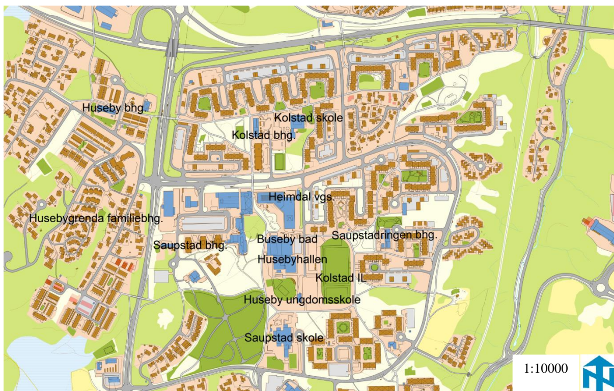
Figur 6 Tjenestetilbud for barn og unge på Saupstad-Kolstad

Fra starten av har Saupstad-Kolstad hatt en rekke private og offentlige sørvisfunksjoner, i form av barnehager, skoler, idrettshall, svømmehall, idrettspark, bibliotek, post, handel, og andre nærings- og sørvisfunksjoner (Trondheim kommune 2013a, s. 9). Det finnes i dag en rekke offentlige-, frivillige- og næringsaktører med tilbud rettet mot barn og unge i bydelen.