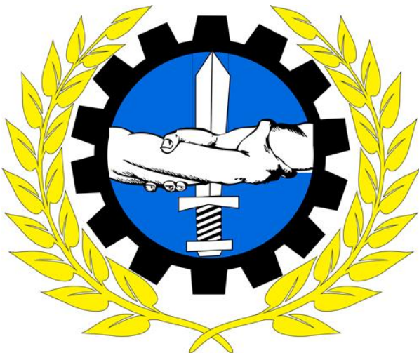
Figur 4 Symbol Solidaritetsaksjonen (Golden Dawn - International New Room 2013a)

mer graverende er bildene av nåværende leder Michaloliakos og nestleder Pappas stående,