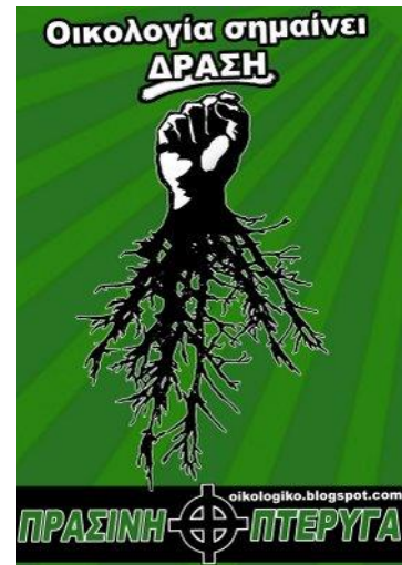
Figur 6 Symbol Grønn Vinge (Golden Dawn - International News Room 2013b)

var tydelig nok, så har de sanger som «Rock for the fatherland» som har tekstlinjen: «We do do not want any foreigners and parasites in our land. Andre sanger de på bandets repertoar er «Auschwitz» og «Mila Ellinika i Psopa» («Speak Greek or Die»). Å bruke musikk som kulturuttrykk er ofte vanlig i høyreekstreme miljøer, spesielt musikk i sjangere som punk og oi er populært, sammen med ska og reggae (Laqueur 1996: 126; Eiternes og Fangen 2002: 66-70). Mye av denne musikken høres ut som andre musikkuttrykk innen man hører nærmere på tekstene som oftest har svært grove linjer som vist til ovenfor.