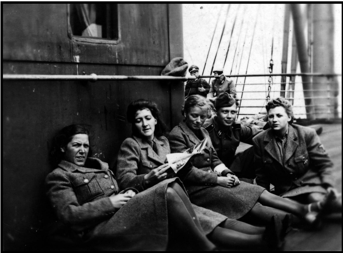
Under: Frontsøstre og SS-soldater ombord på Monte Rosa, på vei til Tyskland. Dette bildet er tatt rett før/etter det som vises i boka til Egil Ulateig.