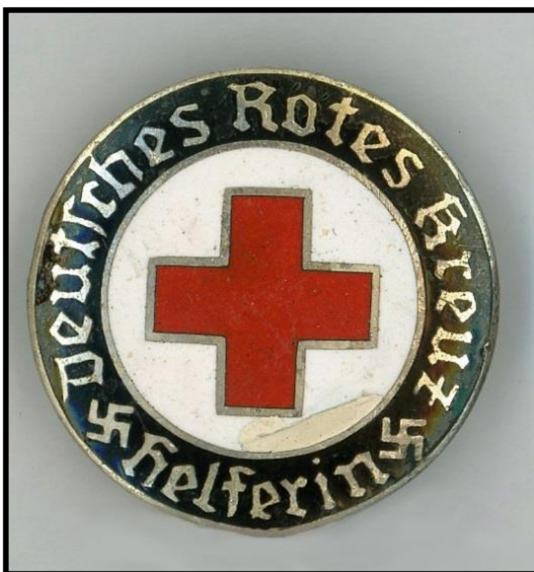
Venstre: brosje som ble gitt til sykesøstre i DRK. Det var forskjellige typer og varianter, alt etter hvilken stilling/tittel man hadde. Dette er brosjen til en 'Helferin'.