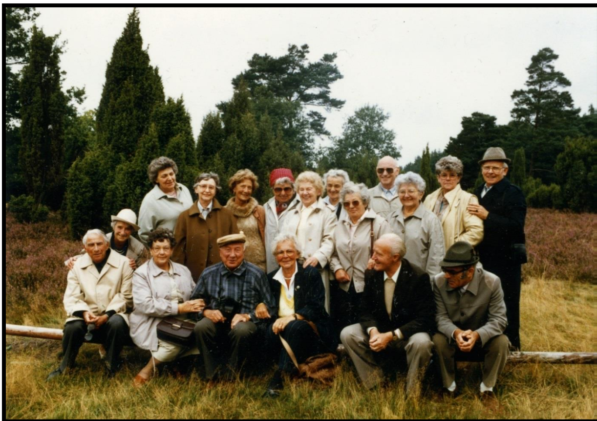
Over: Bilde tatt i Celle 1986 "Die Minsker". Fra et av veteranmøtene, September 1986. Dette var da de gjenlevende fra SS-Lazarett Minsk.