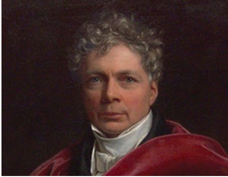
Friedrich W.J. von Schelling

Katedralskole i 1751 og kom til å spille en aktiv rolle i det lille intellektuelle miljøet der. Han ble professor i historie ved Sorø akademi i 1765. Han var en svært produktiv forsker.