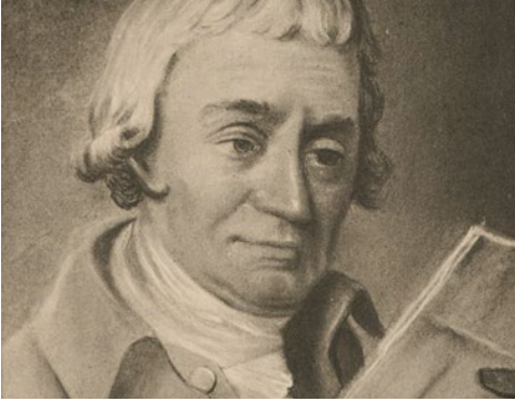
Christian Gottlob Heyne

Under Heynes ledelse ble biblioteket i Göttingen et meget velansett bibliotek i Tyskland som flere norske og danske studenter og forskere besøkte. Det gjorde også vår egen Georg Sverdrup som beskrev biblioteket der i lyriske toner.