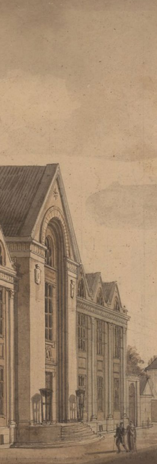
Metropolitainskolen i København