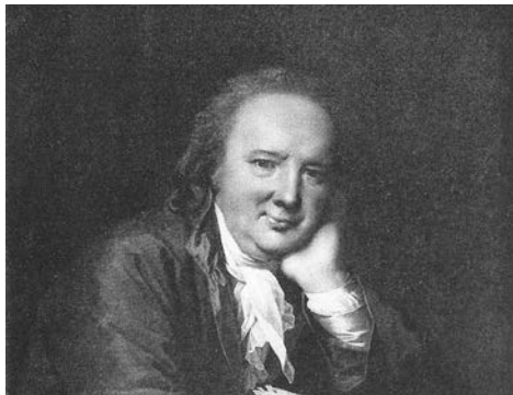
Peder Fredrik Suhm

Teologisk embetseksamen i København 1657. Han regnes som grunnleggeren av moderne historieskriving i Norge. Hans viktigste verk om norsk historie, på latin «Historia rerum Norvegicarum» utkom i 4 bind i København 1711, oversatt til norsk for første gang i 2008. Dette verket var, ved siden av Snorre, svært viktig for nasjonalselvforståelse på 1700- og 1800-tallet.