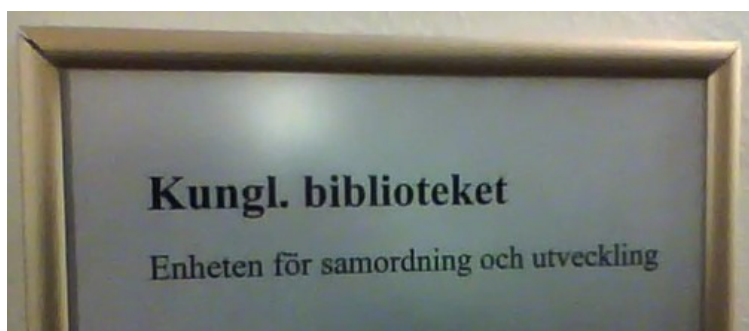
Figur 1: Trenger vi en slik “enhet” ved UBO?