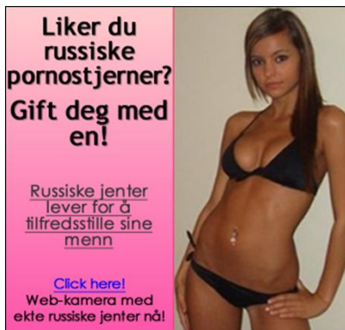
Blikkfang: Annonse frå pornonettstaden Tube8 .