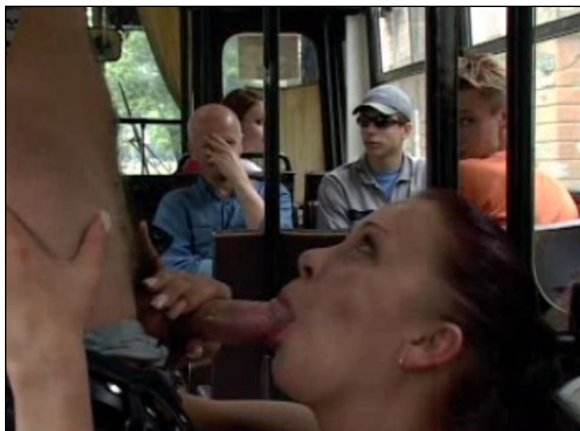
Tilskodar mot sin vilje: Sex på bussen blant raudmande medpassasjerar i filmen Vsio dozvoleno .