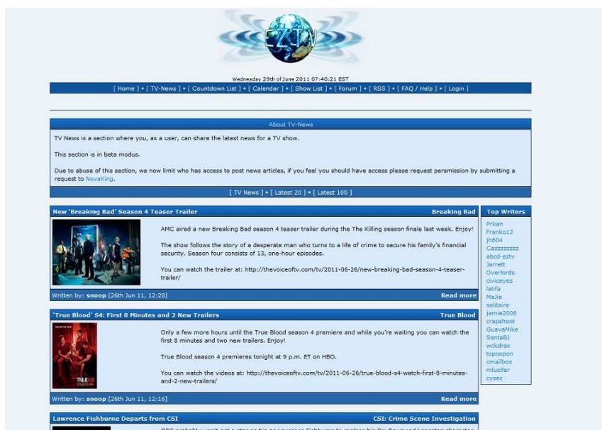
Figur 5 «ez.it».

De brukte også internettsider som hadde oversikter over de amerikanske tv-serienes sesongstarter, pauser og nyheter. Figur 5 viser en internettside som heter ez.it 23 .