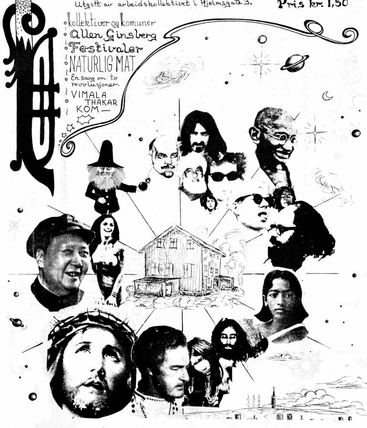
Forside til Kimen (PH5) , 1970.