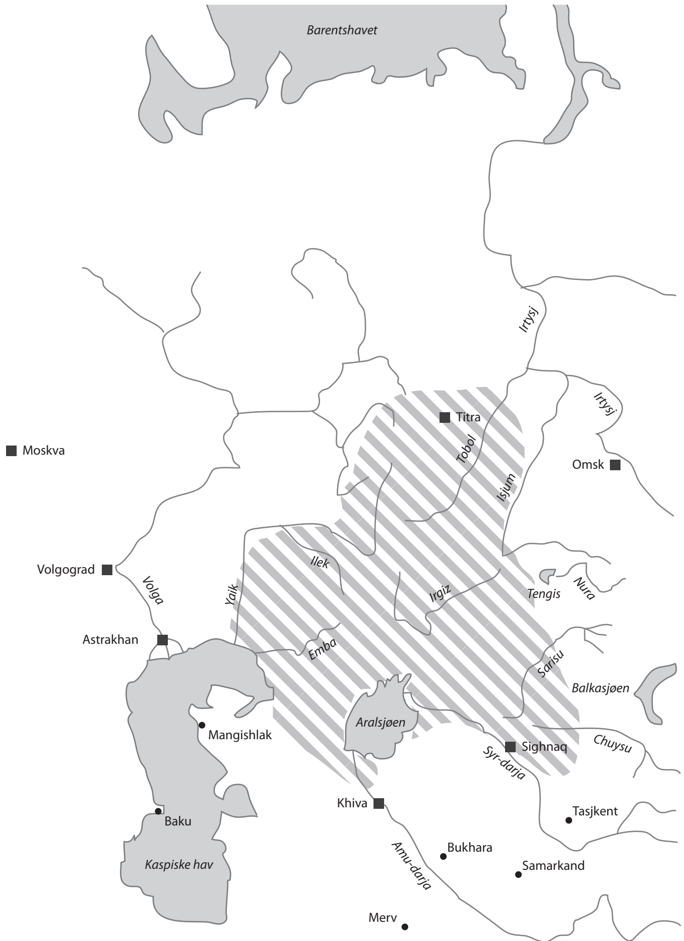
fig.1.1 Stammekonføderasjonen usbek ca. 1400