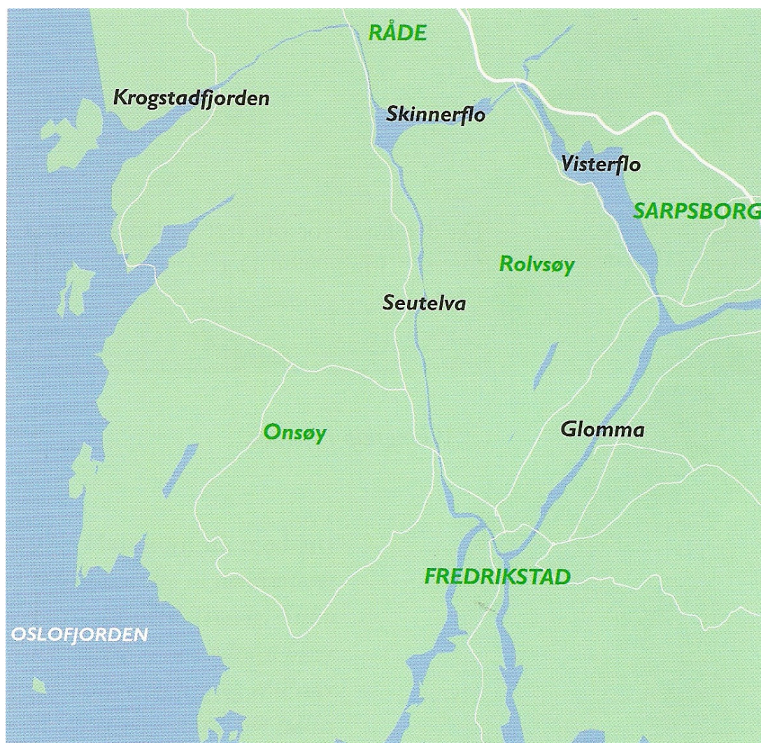
Kartskisse over Glommas vestre og østre løp. Kartillustrasjon: Eigill Tangen