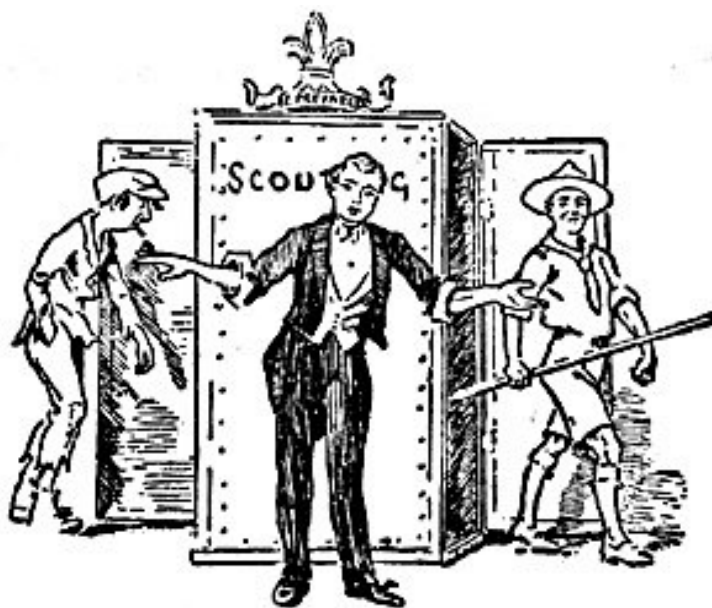
The Scoutmaster's conjuring trick Tegnet av Robert Baden-Powell

Jeg har med dette forsøkt så besvare de spørsmål jeg stilte innledningsvis, hvordan speiderbevegelsen kom til Norge og etablerte seg i to forbund, hvilke mannsidealer disse forbundene forfektet, og hva dette sier om forbundene. 77 Det primære målet med oppgaven har vært å kritisk dokumentere etableringen av bevegelsen, og i andre omgang å sette den inn i en historisk sammenheng innen et felt som kun i liten grad er utforsket i Norge. Derfor har jeg har kalt dette siste kapittelet et forsøk på overblikk; det er et forsøk på å forstå det jeg har funnet i bevegelsens første år, et forsøk på å forstå en virkelighet der det fantes en individuell løsning på sosiale problemer; alt man behøvde var dannelse, og så var problemet løst. Nesten som ved et trylleslag.