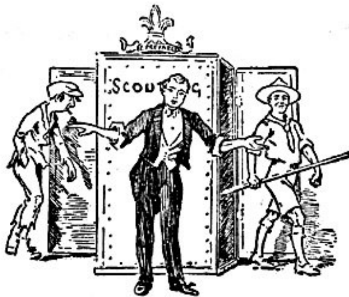
The Scoutmaster's conjuring trick Tegnet av Robert Baden-Powell

Jeg har med dette forsøkt så besvare de spørsmål jeg stilte innledningsvis, hvordan speiderbevegelsen kom til Norge og etablerte seg i to forbund, hvilke mannsidealer disse forbundene forfektet, og hva dette sier om forbundene. 77 Det primære målet med oppgaven har vært å kritisk dokumentere etableringen av bevegelsen, og i andre omgang å sette den inn i en historisk sammenheng innen et felt som kun i liten grad er utforsket i Norge. Derfor har jeg har kalt dette siste kapittelet et forsøk på overblikk; det er et forsøk på å forstå det jeg har funnet i bevegelsens første år, et forsøk på å forstå en virkelighet der det fantes en individuell løsning på sosiale problemer; alt man behøvde var dannelse, og så var problemet løst. Nesten som ved et trylleslag.