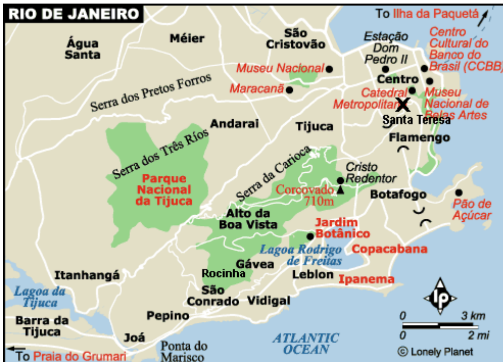
Rio De Janeiro. X = Rua do João (Lonely Planet, redigert av undertegnede)