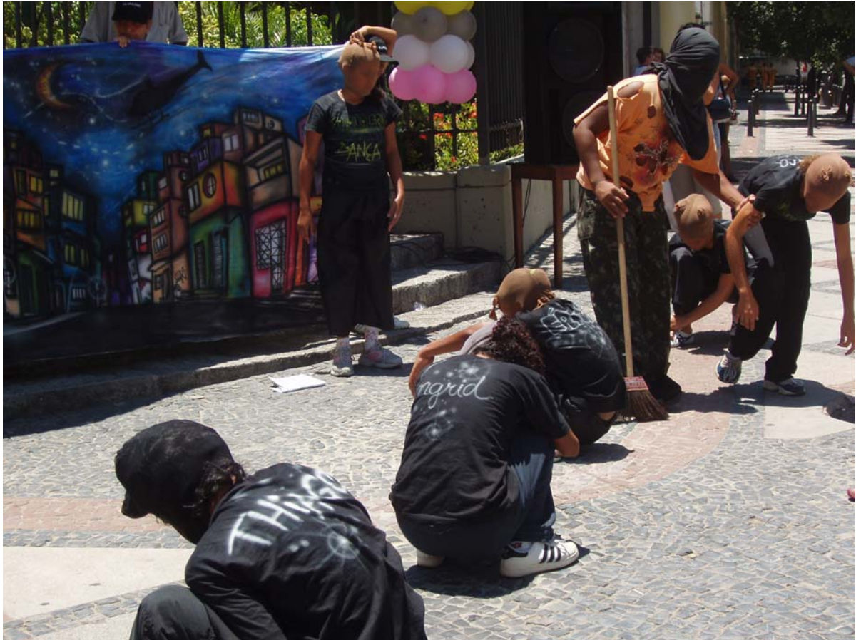
Dansegruppen Salamaleque fremfører en dramatisering av maskert politi(i oransje) som renser gatene for "identitetsløse" gatebarn og hjemløse. Gruppen består av barn fra to favelaer. Her opptrer de på "kulturlørdag", en markedsdag i centro.