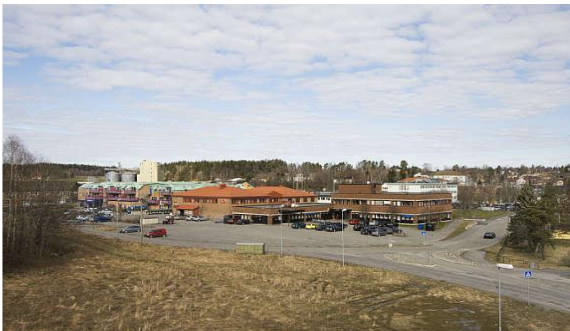
Figur 4. Bildet viser deler av Vestby sentrum. 8

Kommunen har et hovedmål om å utvikle Vestby sentrum til et ”livskraftig kommunesenter” med forretninger, tjenesteyting og kulturtilbud (Vestby kommune 2007). For å nå disse målene, er det planlagt å trekke privat kapital til Vestby sentrum slik at innbyggerne kan ha enkel og rask tilgang til varehandel og opplevelsestilbud. Kommunen ønsker å tilrettelegge slik at sentrumsområdet i større grad enn i dag kan innby til aktivitet på både dag og kveldstid. En slik utvikling vil kunne være med på å gi eksisterende og nye innbyggere større muligheter til å benytte seg av området og således skape et ”levende sentrum”.