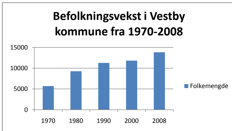
Tabell 1. Befolkningsvekst i Vestby kommune. 13

Vestby kommune har hatt en stor befolkningsvekst i løpet av de siste 30 årene. Den første store veksten i innbyggertallet, kan ses i sammenheng med utbyggingen av boligfeltene Pepperstad Skog i Vestby, og Store Brevik i Son på slutten av 1970-tallet. Fra 1970 til 1980 vokste innbyggertallet i Vestby kommune med 62,6%, fra 5 697 til 9 267 innbyggere (se tabell 1).