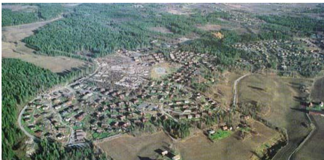
Figur 3. Et tidlig luftfotografi av Pepperstad Skog. I dag er flere områder bygget ut. 6

Kommunikasjonen til Vestby sentrum, og jernbanen (ca. 3 km), kan likevel sies å være god, i hvert fall morgen og ettermiddag da en stor andel av innbyggerne pendler til og fra arbeid. På Pepperstad Skog finnes det barnehager, barneskole, ungdomskole og idrettshall med en utendørs fotballbane i grus. I forbindelse med barneskolen er det også i løpet av de siste årene bygget et grendehus til utleie for private arrangementer. Skogen er, som man kan se av bildet over (figur 3), lett tilgjengelig. Man kan nå to av kommunens ti strender, Hvitsten og Emmerstad, med sykkel gjennom skogen i løpet av en halvtime, eller på et kvarters tid med bil.