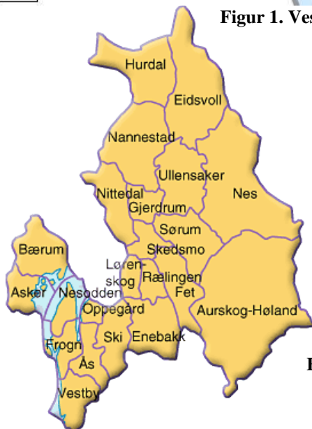
Figur 2. Oversiktskart over Akershus. Kilde: norge.no 3