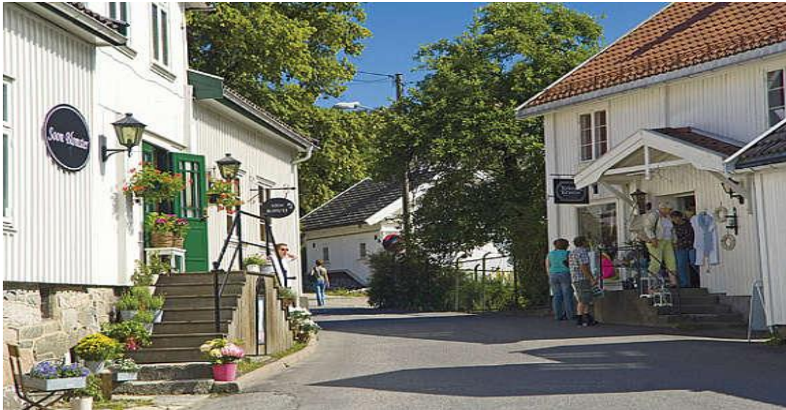
Figur 6. Fra Son sentrum. 11

i debatter i lokalmediene, gjennom protestmarsjer og i opprettelsen av en egen kommunedelplan for Son. Det er tydelig at en gruppe innbyggere i Son har andre bilder av hva stedet skal representere og hvordan det skal utvikles, enn kommunepolitikerne. Hovedessensen i protestene ligger i at utbyggingen ødelegger Sons ”karakter”.