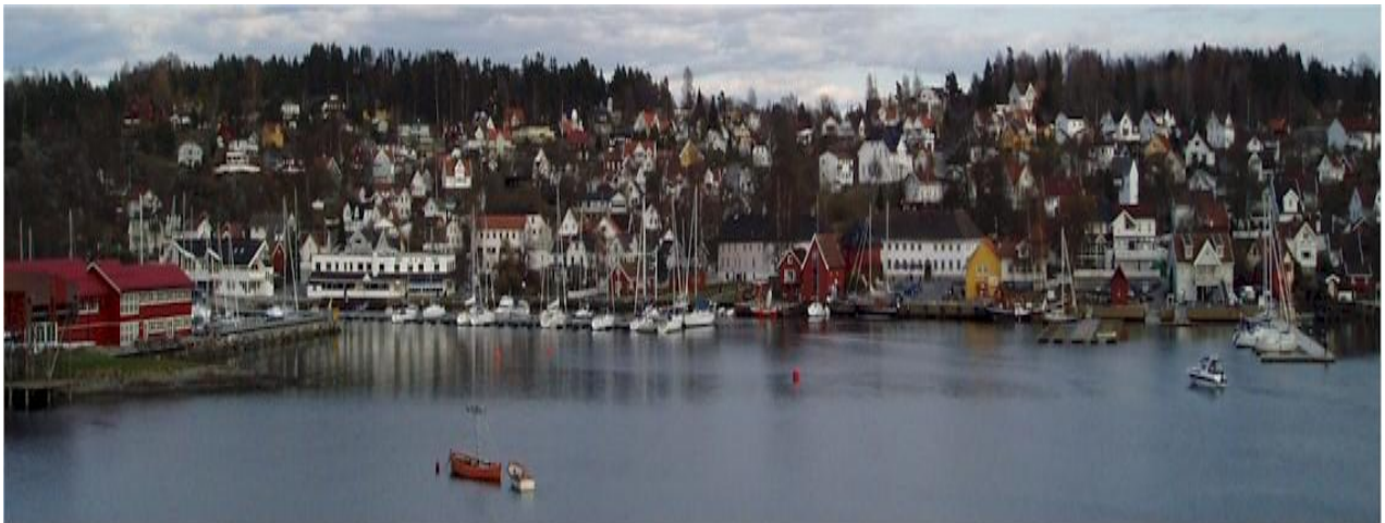
Figur 5. Son. 10

Kunstnere har opp igjennom tiden søkt seg til Son, og stedet er i dag kjent som hjemsted for mange malere, kunsthåndverkere, musikere, diktere og keramikere. En slik ”kunstnerstatus” kan sies å være positivt for Son da det er med på å gi stedet en spesiell ”atmosfære”. Selv om det ikke er enighet om hva det egentlig betyr å markedsføre, eller betegne, Son som ”Kunstnerbyen”, blir denne betegnelsen ofte brukt. 9