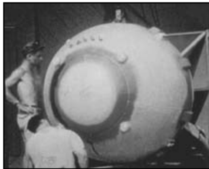
Fat Man var et implosjonsvåpen og ble sluppet over Nagasaki.

Det andre prinsippet for fisjonsvåpen skaper overkritikalitet på en langt hurtigere måte enn ved kanonmodellen, og da er også plutonium-239 praktisk å anvende. Man starter med et underkritisk kuleskall (det vil si en kule med tomrom i midten) av fissilt materiale. Ved detonasjonen forårsaker et om-liggende kjemisk eksplosiv skape et innoverrettet trykk som komprimerer skallet til en liten kule i midten. Dette kalles implosjonsmodellen, implosjon er en innoverrettet eksplosjon. Ansamlingen blir overkritisk fordi implosjonen øker tettheten av kjerner og endrer formen fra skall til kule. Man slipper så løs frie nøytroner på det «optimale» tidspunktet, og da starter den kjernefysiske eksplosjonen.