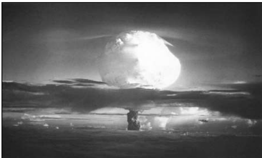
Verdens første termonukleære eksplosjon var amerikansk og ble detonert på Marshalløyene i Stillehavet i 1952. Sprengkraften var ca 500 ganger større enn bombene fra 1945.

materialet 4 . I mange av fusjonsvåpnene gir fisjonsreaksjonene faktisk det største bidraget til den totale energifrigjøringen, ifølge litteraturen. Oppbygningen av fusjonsvåpen er altså en smart måte å fisjonere uran på.