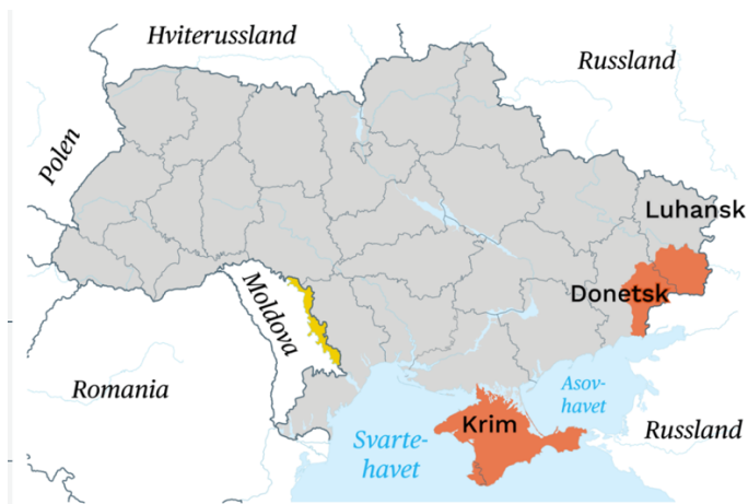
Figur 1: Kart over Ukraina med landegrensler. Russiskannoterte Krim, samt utbryterrepublikkene i Donetsk og Luhansk er markert med rødt. Hentet fra Store norske leksikon (2023, 7. mars)