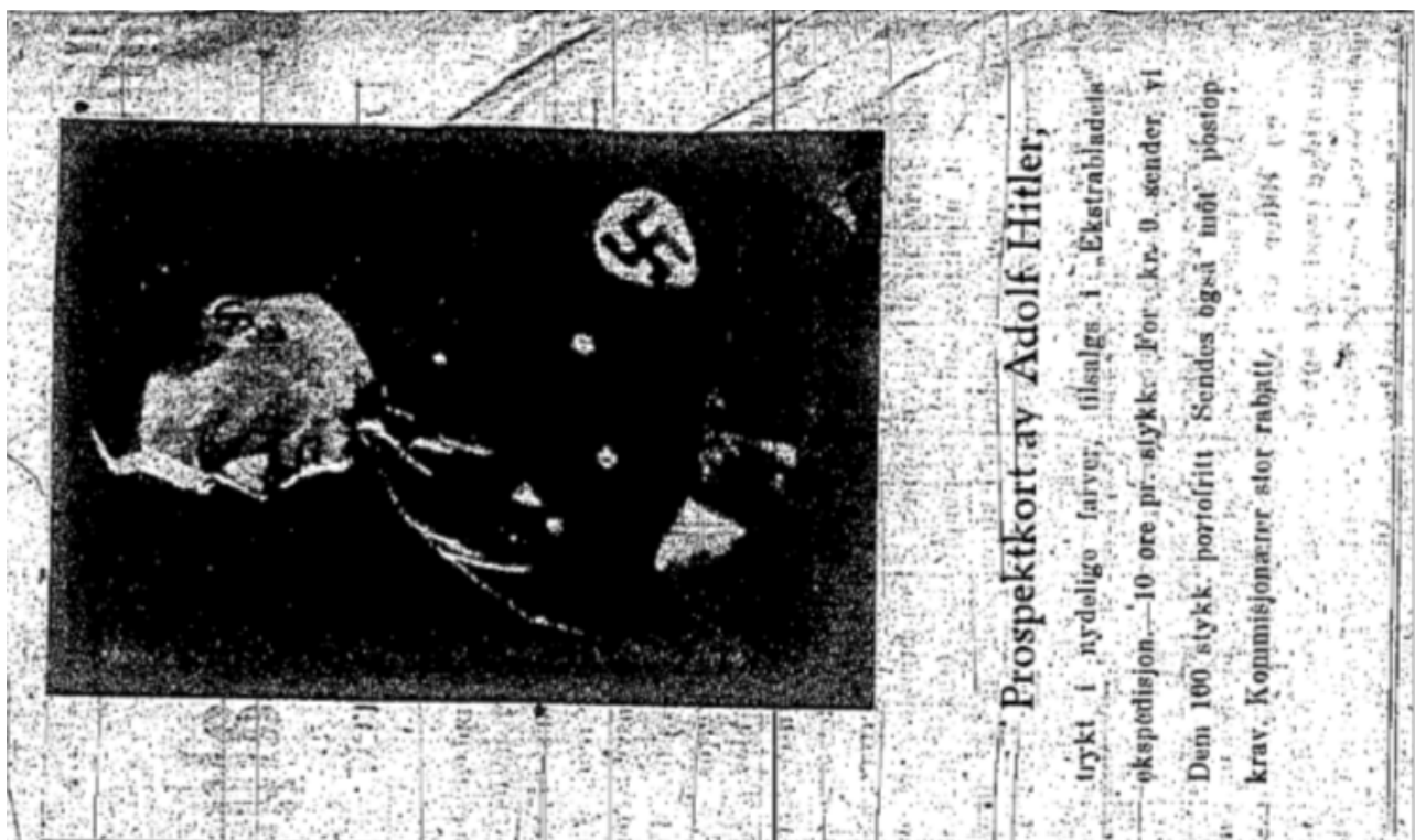
Øverst: Norsk hakekorssang i Ekstrabladet .